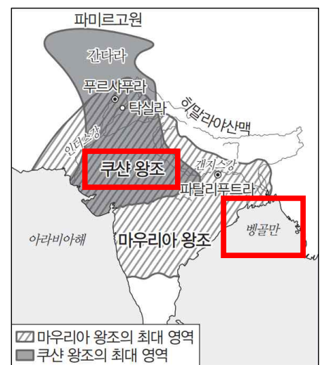
2022학년도 수능특강 56p

② 벵골만은 인도 동부에 위치한 만입니다. 그러나 쿠산 왕조는 인도 서북부, 즉 편자브 지역과 간다라 지역에 걸쳐 위치했던 국가입니다. 또한, 오른쪽의 지도를 보면 알 수 있듯, 쿠산 왕조의 최대 영역은 벵골만과 맞닿아 있지 않습니다. 이 점으로 미루어 보아, 쿠산 왕조는 벵골만으로 진격하지 않았음을 추론할 수 있습니다.