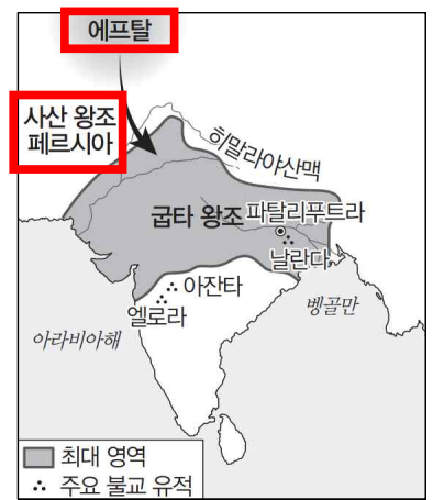
2022학년도 수능특강 57p 굽타 왕조 관련 이미지

: (가) 국가가 에프탈의 서쪽에서, 돌궐이 에프탈의 북쪽에서 공격해 에프탈이 멸망하였다고 서술하고 있습니다. 에프탈은 5~7세기에 아프가니스탄 지역을 지배하던 민족이었습니다. 이 점으로 미루어 보아, (가) 국가는 5~7세기경 아프가니스탄 지역의 서쪽에 위치했던 국가임을 추론할 수 있습니다. 이 점으로 미루어 보아, (가) 국가는 3~7세기에 아프가니스탄 지역의 서쪽, 즉 페르시아 지역에 위치했던 사산 왕조 페르시아임을 추론할 수 있습니다.